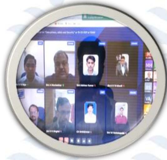
"डेटा की गोपनीयता, सुरक्षा एवं बचाव" पर 19 फरवरी, 2021 को आयोजित वेबिनार