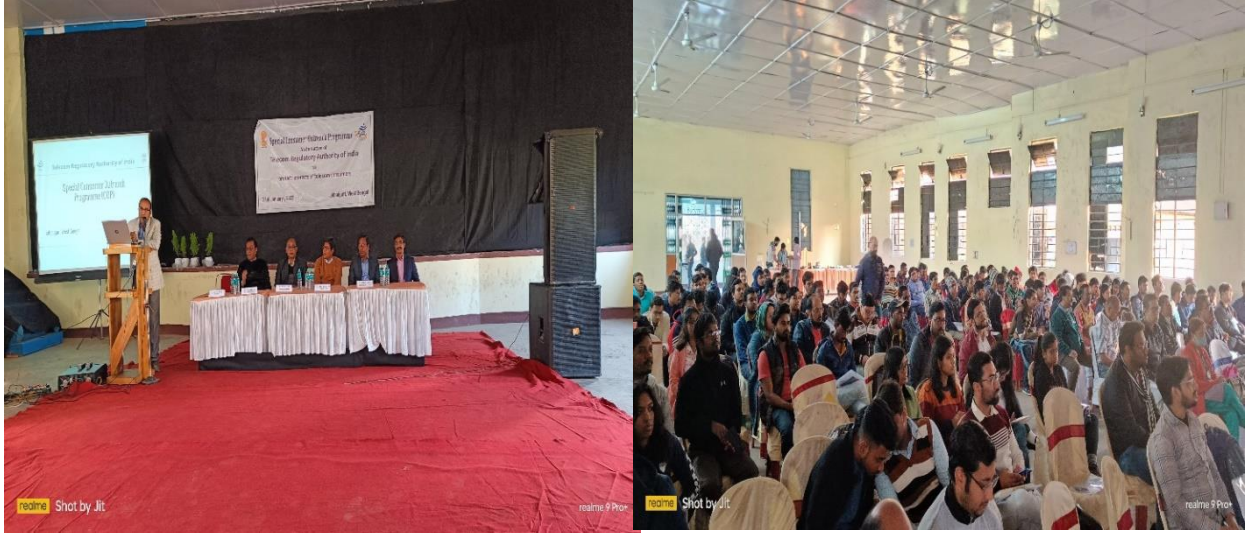
क्षेत्रीय कार्यालय, कोलकाता द्वारा 21 जनवरी 23 को जलपाईगुड़ी (पश्चिम बंगाल) में छात्रों के लिए आयोजित विशेष उपभोक्ता संपर्क कार्यक्रम