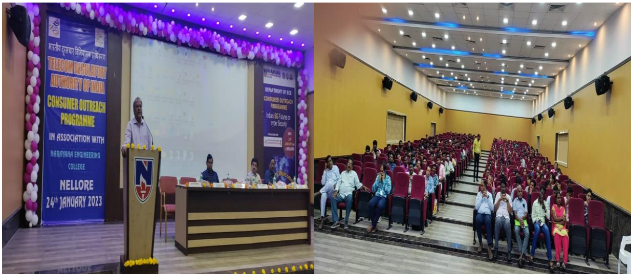
क्षेत्रीय कार्यालय, हैदराबाद द्वारा 24 जनवरी 23 को नेल्लोर (आंध्र प्रदेश) में छात्रों के लिए आयोजित विशेष उपभोक्ता संपर्क कार्यक्रम